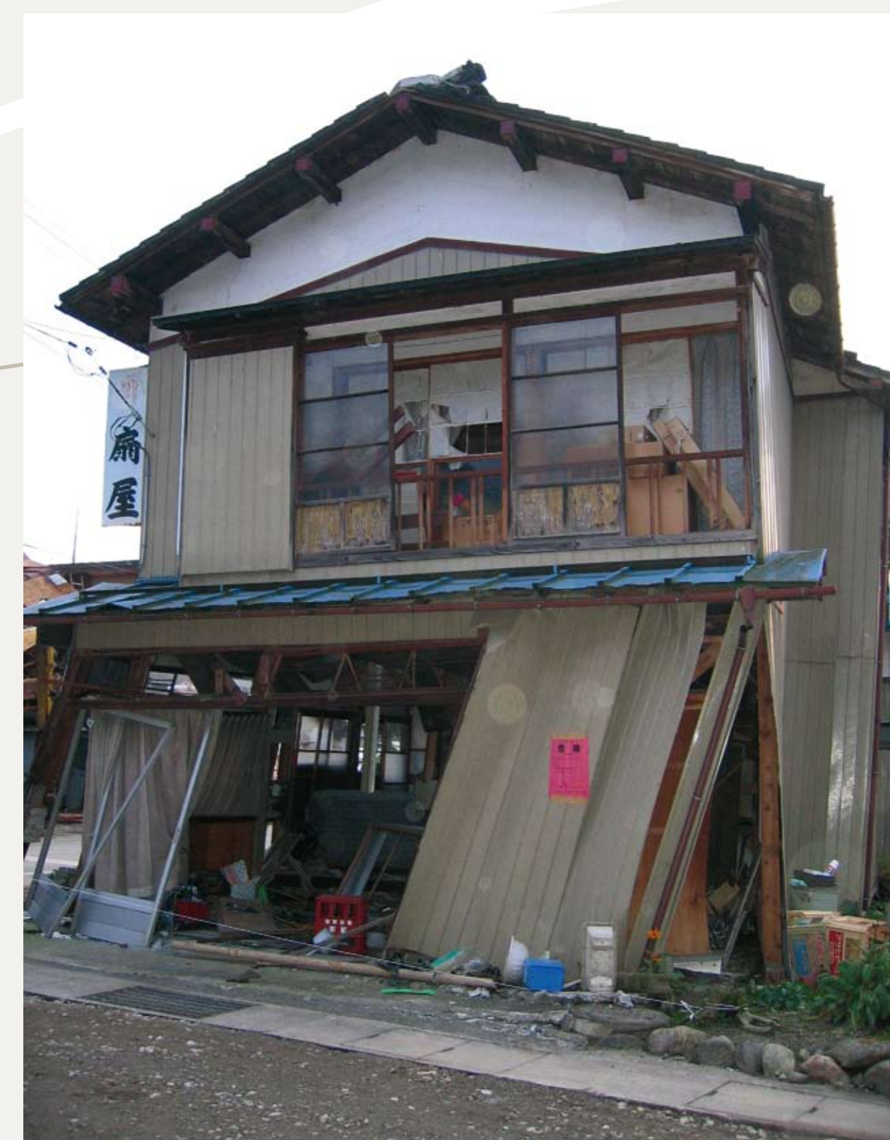
Diagnostic de l'état du bâti et mesures de protection (vignettes colorées). Photos prises au Japon en 2004, cette méthode de diagnostic et mise en sûreté n'a pas encore été appliquée en France.